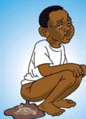
Diarrhées à rotavirus