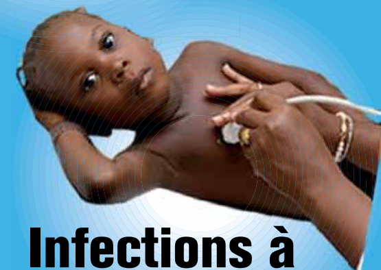
Infections à pneumocoques