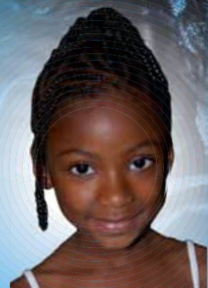
Cancer du col de l'utérus